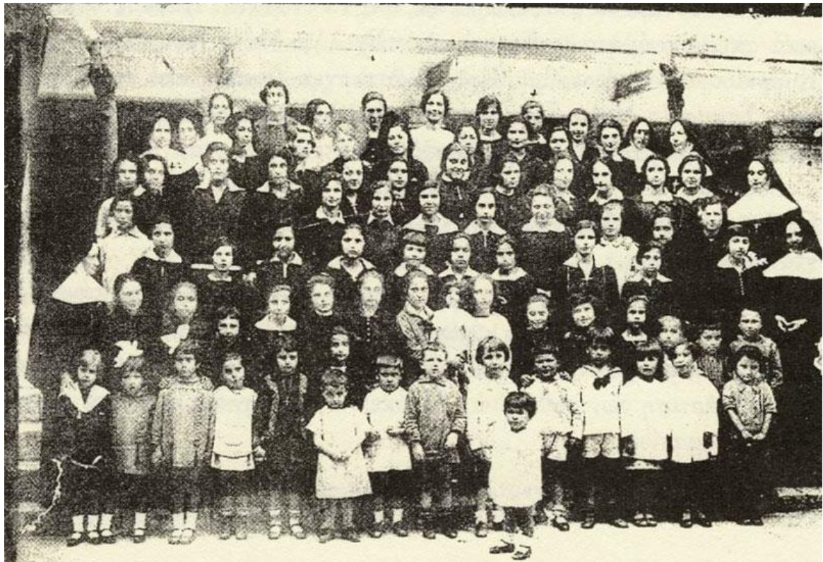
Παιδιά από τη Σάμο και την Αρμενία με τις Καλόγριες στην αυλή της Σχολής

Στη Σχολή του Αγίου Ιωσήφ γενικά υπήρχε μια τάξη, που ετηρείτο κατά τρόπο αυστηρό. Πάντως αν κάποια κοπέλα έκανε κάτι που ξέφευγε από τα πλαίσια της Σχολής δεν την τιμωρούσαν. Της μιλούσαν, συζητούσαν το πρόβλημα, προσπαθώντας να δώσουν λύση από κοινού. Για να φωνάξει μια μαθήτρια η ma mere , η Διευθύντρια, θα έπρεπε να έχει συμβεί κάποιο σοβαρό παράπτωμα. Συνήθως τα πειθαρχικά θέματα τα χειριζόταν κάποιο διάστημα η Soeur Cecile . Ωστόσο οι περιπτώσεις αυτές ήταν σπάνιες. Στη Σχολή επικρατούσε ευρυθμία, γαλήνη, ησυχία, συνεργασία και ευχάριστη ατμόσφαιρα.